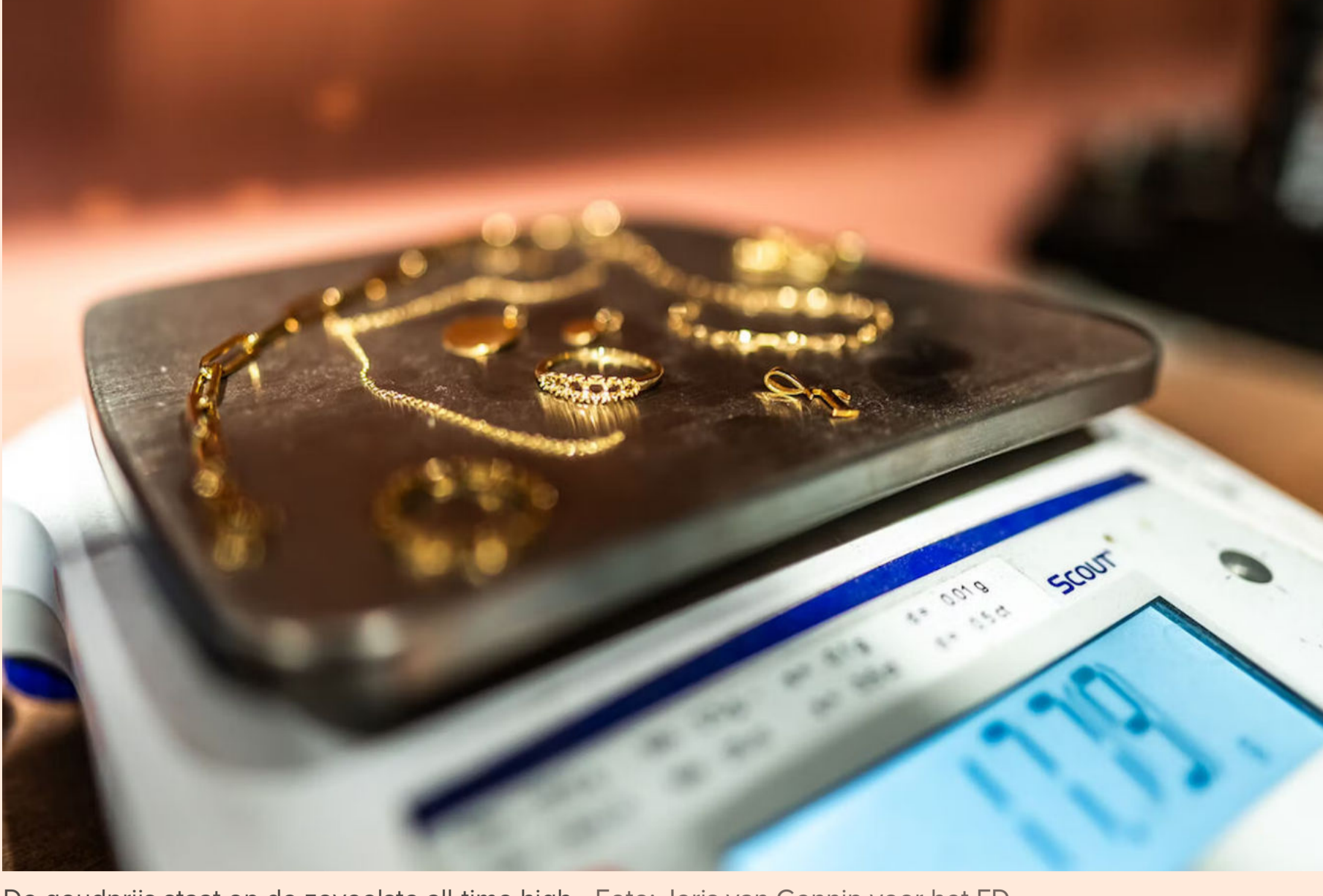
De goudprijs staat op de zoveelste all-time high.

Nu de goudprijs dit jaar record na record breekt, merken juweliers dat zij de prijzen moeten opschroeven. ‘Klanten vinden dat we heel duur zijn geworden.’